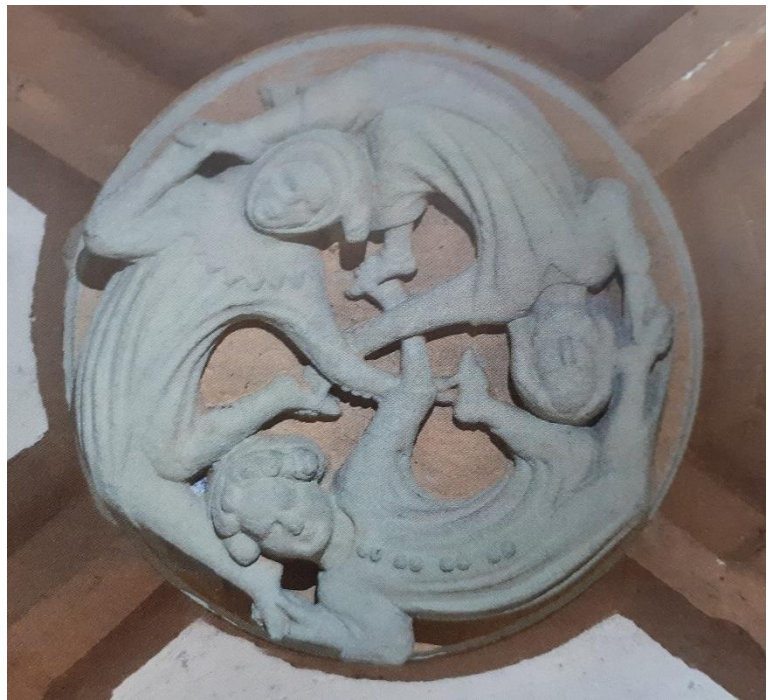
Schlussstein im Dom zu Fritzlar, Darstellung der Dreifaltigkeit